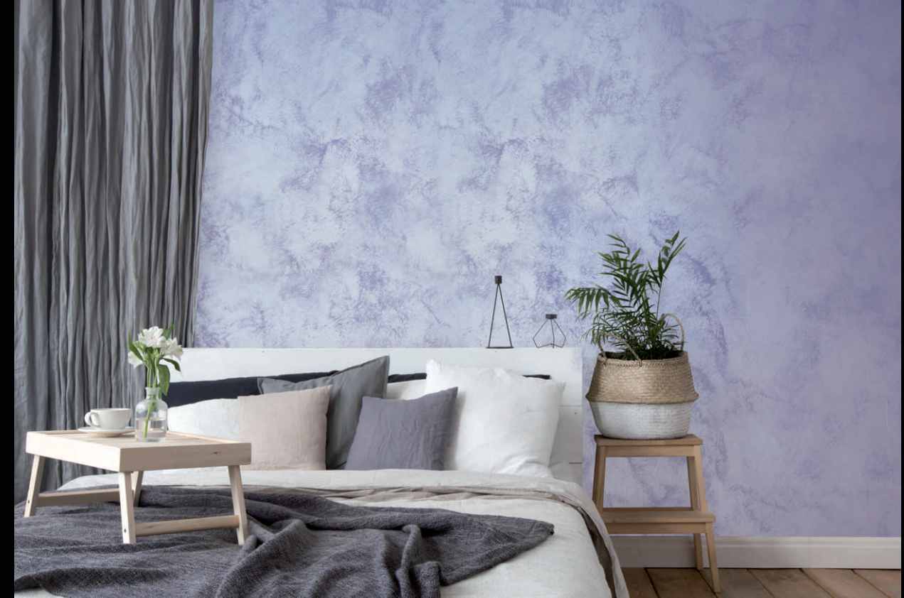
BASE CALIPSO CHIC